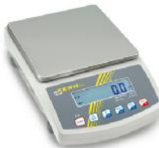
▲ Váhy PLJ