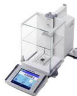
▲ analytické váhy XP