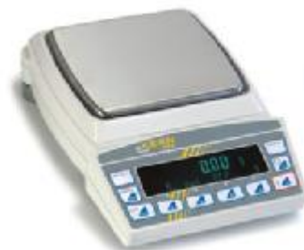
▲ PRS, PRJ