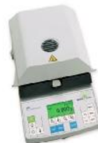
▲ HB 43-S