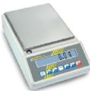
▲ Váhy 572

Váhy 572 se necejchují, váhy 573 lze ověřovat..