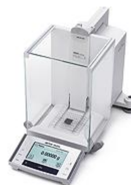
▲ analytické váhy XS