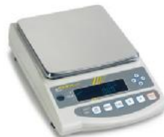
▲ PES, PEJ