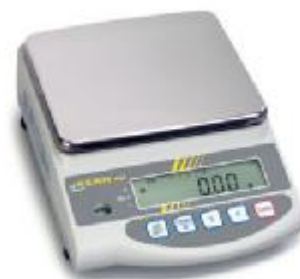
▲ EW-N, EG-N

Přesné váhy, které lze cejchovat.. U vah typu EW je externí kalibrace, u vah typu EG je interní kalibrace-kalibrace probíhá automaticky při spuštění.. Váhy umožňují toleranční vážení a spodní závěsné vážení, lze přibojednat sadu pro měření hustoty.