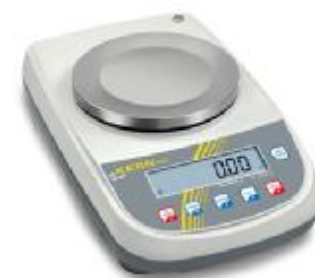
▲ Váhy PLS